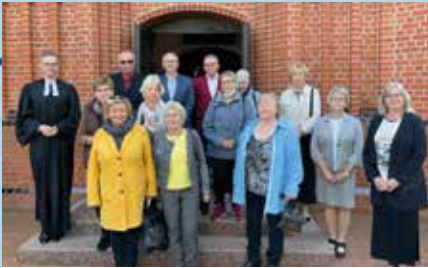
Goldene Konfirmationen 1970