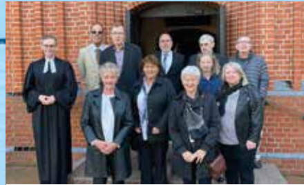
Goldene Konfirmationen 1971