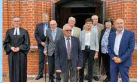
Diamantene Konfirmation 1961