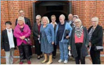
Diamantene Konfirmation 1960